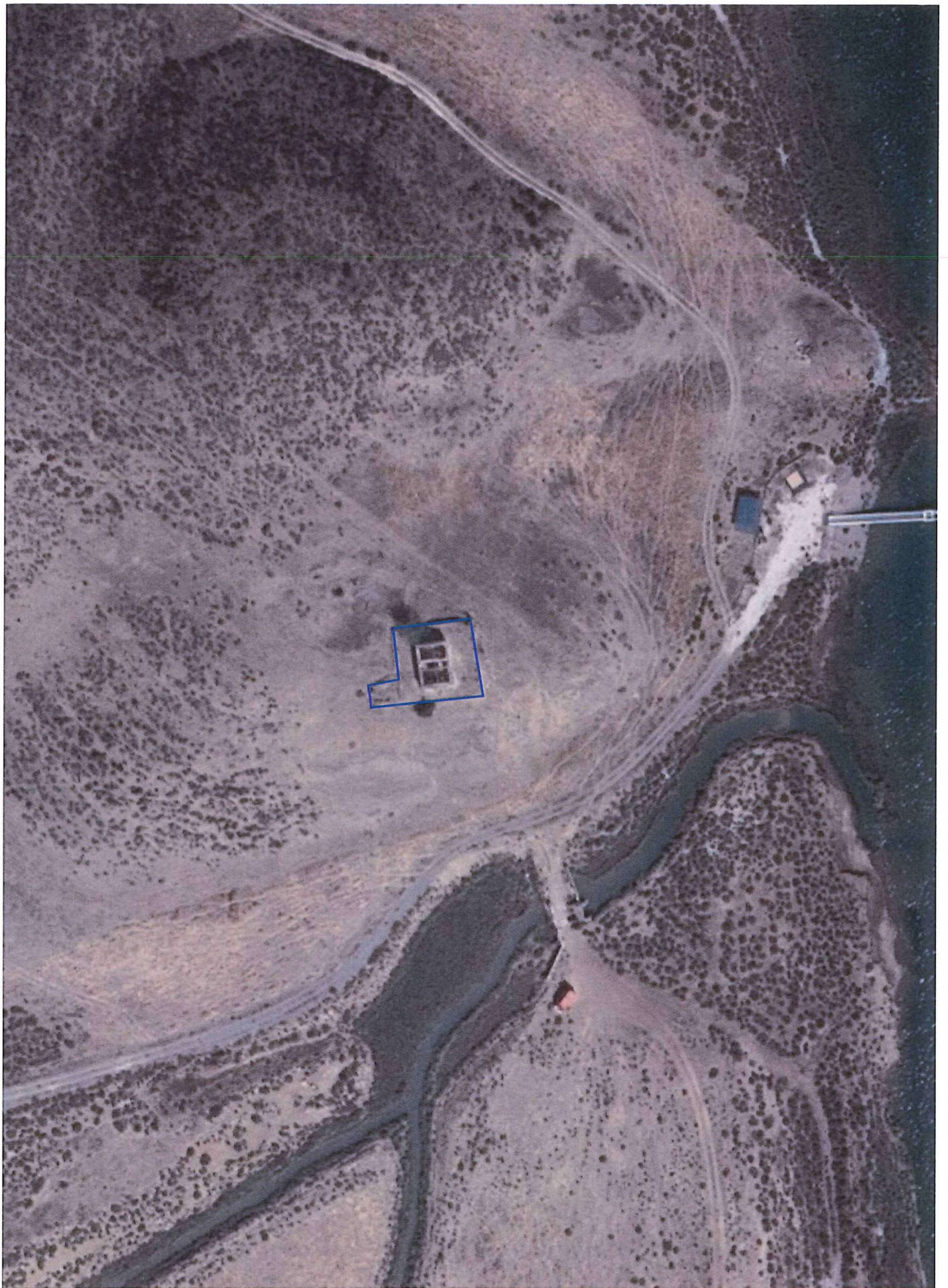
Ortofotomapa Escala 1/1000